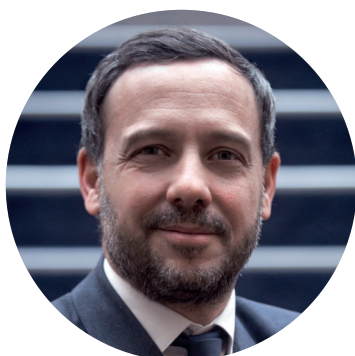
ADRIEN TAQUET Secrétaire d'État

Cette stratégie sera également un lieu de dialogue entre l'État et les départements. À rebours d'une vision rigide et datée des enjeux de répartition des compétences (et donc des financements), mon souhait est que nous puissions, de manière pragmatique, améliorer les pratiques et les modes de faire, pas à pas et de manière concrète, sur des sujets aussi essentiels que les délais d'exécution des mesures de justice, les déplacements multiples que subissent certains enfants, le suivi en santé, les impasses de la prise en charge du handicap et de la santé mentale en protection de l'enfance.